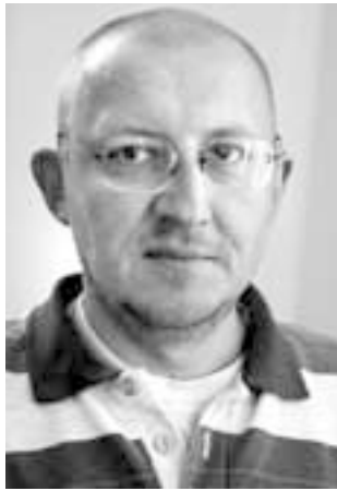
gijnych łączymy się z tymi, co odeszli.

● Dlaczego? – Nasi przodkowie wierzyli, że duchy zmarłych mogą w tę noc przychodzić na ziemię. Zostawiali otwarte furtki, uchylone drzwi, aby duchy mogły bez przeszkód wkroczyć w progi swoich domów. Dziś w wielu systemach reli-