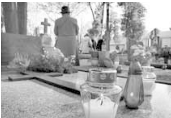
Lubelski cmentarz przy ul. Lipowej

połączone z odmawianiem zwyczajowych pacierzy. W prawosławiu modlitwom w intencji zmarłych patronują św. Dymitr i Jan Chrzyciel (w sierpniowe święto ścięcia Jana Chrzyciela prawosławni wspominają poległych żołnierzy). U luteran nie ma kultu zmarłych, lecz kulturowa jest stała pamięć i troska o groby zmarłych. Przy wielu luteranckich nekropoliach znajduje się dom, w którym mieszka gospodarz opiekujący się cmentarzem. Kalwini polscy dostosowali pamięć o zmarłych do polskiej tradycji, gromadząc się w Dzień Zaduszny w cmentarnych kaplicach na okolicznościowych nabożeństwach. Żydzi wspominają zmarłych w rocznicę śmierci, kiedy zapalają specjalną świecę i odmawiają modlitwę „Boże pełen miłosierdzia” lub tradycyjny kadisz. W rocznicę śmierci słynnych rabinów i cadyków umieszcza się na ich grobach karteczki z prośbami o wstawiennictwo. (PAP)